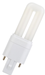
147041 LED PL Verre TC-S G23 2P 2W (5W) 280lm 840 EM+AC