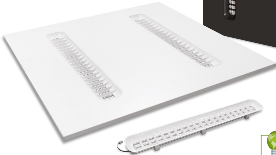
Modules LED magnétiques remplaçables avec grille de défilement