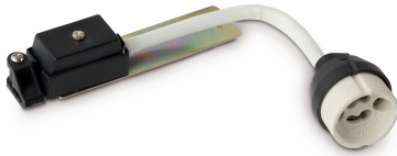
Lampe pour encastré GU10