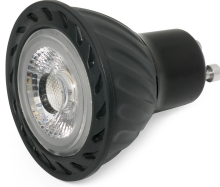
Ampoule GU10 LED 7,7W 2700K 60° NOIRE