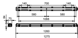
WT050C L1200 1 Tube